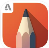
Autodesk SketchBook Draw, paint, & sketch anywhere Autodesk Inc.

Bald ist Ostern! Unser Schaf fängt schon mal an mit Design-Ideen für Ostereier. Und zur Entspannung zwischen durch ein Mandala: Mit der App „SketchBook“ von Autodesk (Apple & Android) gelangen